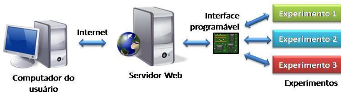
Figura 1: Esquema de um laboratório de Experimentação Remota.

O computador do usuário pode acessar o servidor web através da Internet, buscar informações detalhadas sobre a natureza do experimento e executá-lo. O servidor web permite ao usuário o acesso ao laboratório, o controle dos dispositivos e a obtenção dos resultados do experimento. A interface programável possui basicamente duas funções: interpretar os dados obtidos dos experimentos para que o servidor web possa repassar para o usuário, e interpretar o comando do usuário para que ele seja executado no aparato experimental. Na maioria dos casos, são incluídas câmeras para a visualização do experimento.