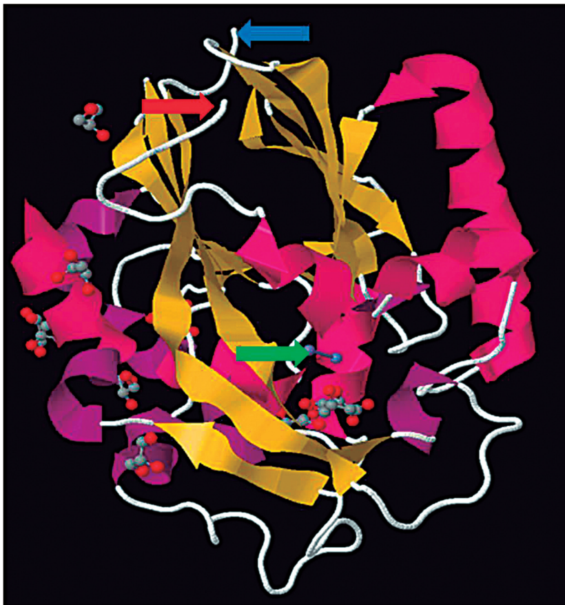
Figura 1. Estructura tridimensional de la enzima AiiA de Bt . En amarillo se presentan las láminas \beta y en rosado las hélices \alpha . La flecha verde indica los átomos de zinc en el motivo estructural H104-XH106-XDH109-H169. Las flechas azul y roja indican los extremos N-terminal y carboxi-terminal respectivamente. Tomado de Protein Data Bank ( http://www.rcsb.org/pdb/home/home.do ) ID PDB: 2A7M.