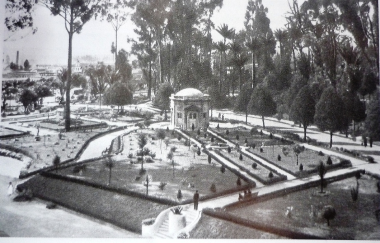
Imagen 2: Kiosco de la Luz, Parque de la Independencia.

Tanto el parque del Centenario como el de la Independencia fueron construidos a las afueras de la ciudad en el próspero sector de San Diego, en la parroquia de Las Nieves. El parque del Centenario se ubicó en lo que anteriormente era la plazuela de San Diego, que se remodeló para darle una nueva y más moderna apariencia. La información en cuanto a los debates en torno a esta ubicación es bastante precaria pero se sabe que debido a la difícil situación económica que atravesaba el país se recomendó a la administración adecuar un espacio que fuera de propiedad de la municipalidad y sólo necesitara remodelarse.