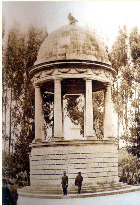
Imagen 1: Templete del Parque del Centenario, 1892.

honor, valentía y libertad, todos valores republicanos. 9 Alrededor de los caminos del parque se plantaron eucaliptos y se construyeron verjas que delimitaban el espacio por donde las personas podían transitar (ver mapa 1). En 1926, la administración de Bogotá incluiría una hermosa escultura de una mujer, La Rebeca, que aunque deteriorada y amenazada por las nuevas construcciones es hoy en día el único recuerdo del parque.