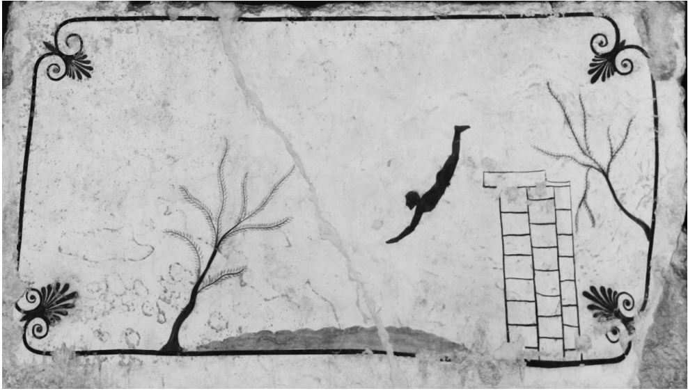
Figure 2. Le Plongeur de Paestum

pression de l'absence 8 : « Si le désir est l'appétit de voir l'absent, l'art voit l'absent » (2014 : 14). Alors, dans L'Homme de Lascaux , « On ignore quelle est l'action qu'on voit mais l'action n'est pas achevée . C'est l'instant d'avant » (2014 : 10, italiques de l'auteur). L'image contemplée ne nous dit pas pourquoi l'homme tombe, ni quel est le récit derrière cette représentation.