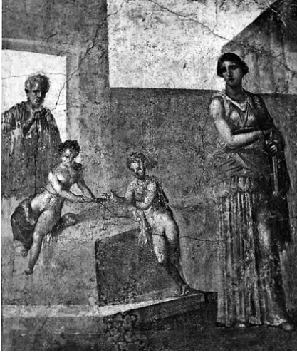
Figure 3. Médée Méditante