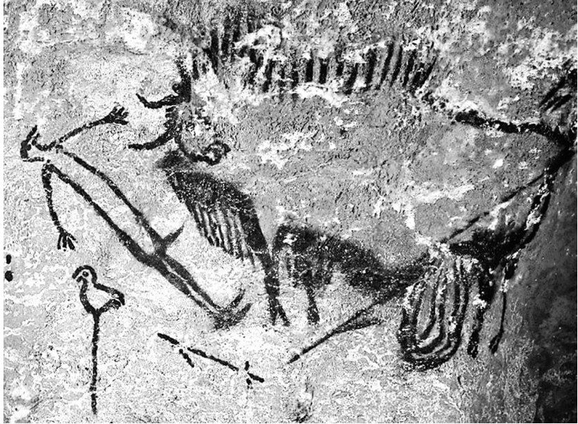
Figure 1. L'Homme de Lascaux