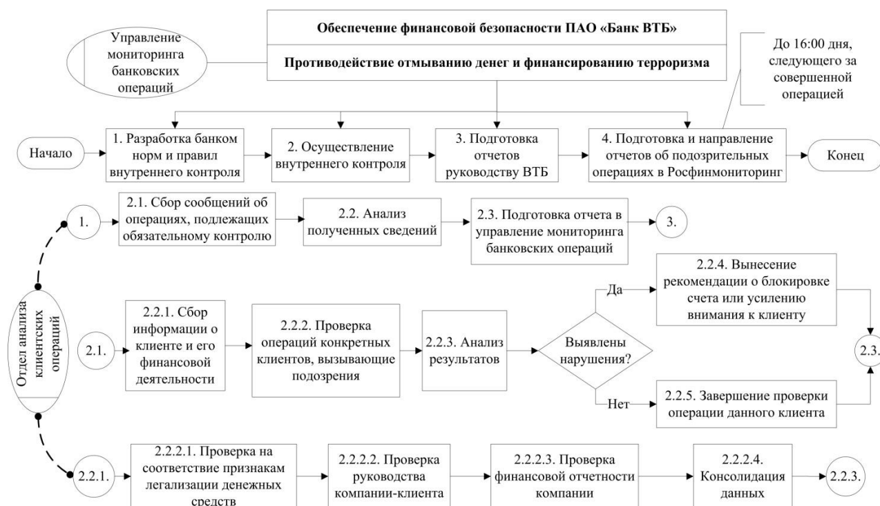
Рис. 2. Система противодействия отмыванию денег и финансирования терроризма

ственные трудности процесс перехода на МСФО доставит мелким региональным компаниям, ограниченным в финансовых и кадровых ресурсах.