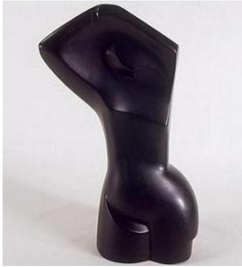
Figura 5. Hortensia Núñez Ladevèze, Torso, 1963.