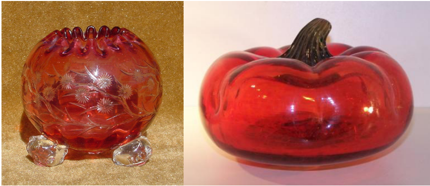
Figura 1A. Stevens & Williams, cuenco Rose , c 1885 (8,3 cm alto).