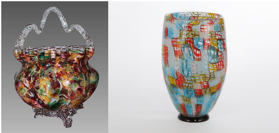
Figura 2A. Stevens & Williams, cesta de murrina, c 1880 (30,5 cm alto).