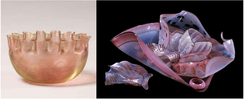
Figura 4A. Stevens & Williams, cuenco de hilos, c 1900 (6,7 cm alto).