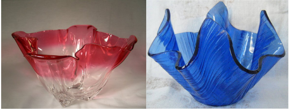
Figura 5A. Steuben, jarrón Grotesque , c 1920 (15,2 x 28,6 cm).