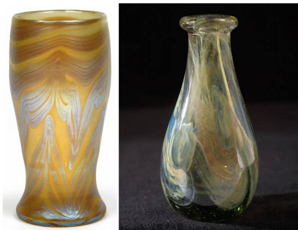
Figura 3A. Loetz, jarrón Phaenomen , c 1900 (17,7 cm alto).