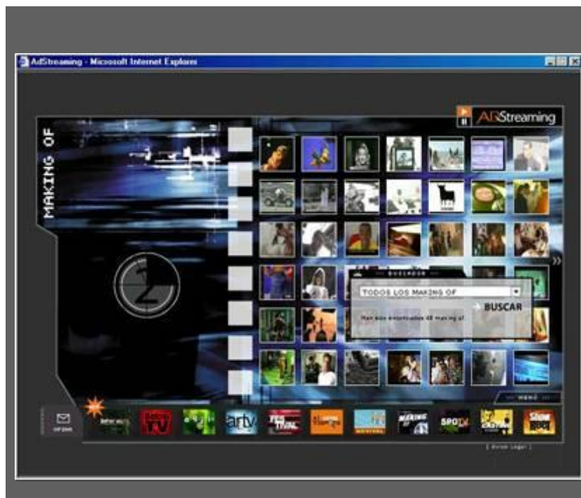
Ilustración 5. AdStreaming. Making Of.

Pubstv.com. Les plus drôles et les plus belles publicités du monde