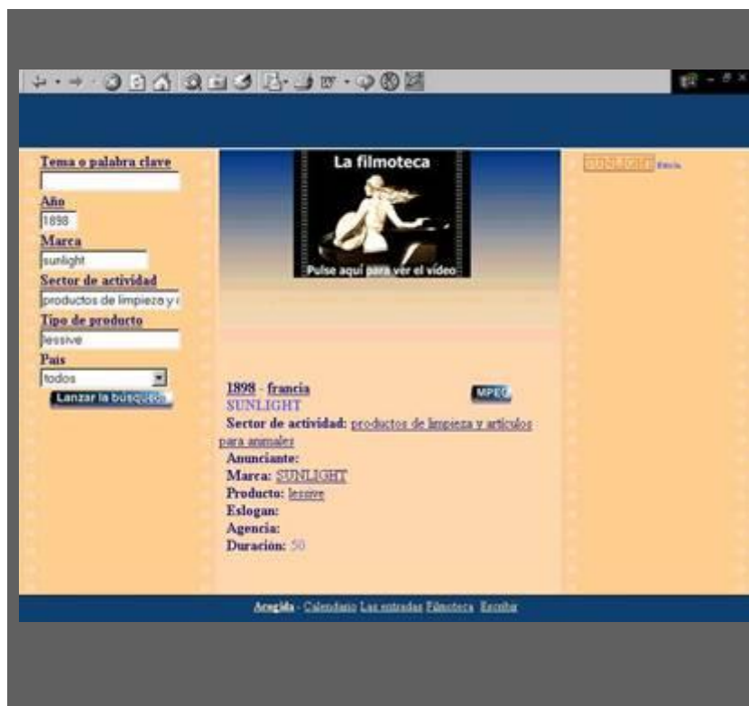
Ilustración 7. Pantalla de la base de datos de la Cinemateca con el resultado de la búsqueda perteneciente a film realizado por los Hermanos Lumière para Sunlight

La base de datos sobresale por la clasificación diseñada para identificación de cada film, que como ya hemos señalado en trabajos previos [22] , tiene que atender a la característica del producto anunciado y no al argumento de la película. Así, dispondremos de dos campos que se complementan, «Sector de Actividad», con 38 sectores, y «Tipo de producto», con más de 850 productos.