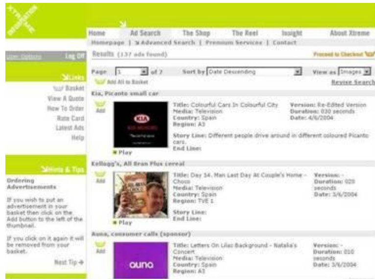
Ilustración 2. Xtreme. Base de datos

Con la dirección ubicada en Londres y con sucursales en Francia, Alemania, Italia, EEUU, Filipinas y Australia, propone a todos los clientes potenciales la redacción de informe sobre empresas, de los sectores económicos, de los consumidores, de la competencia, penetración y protección de la marca, etc. Además cuenta con magníficos productos, como The Reel Net < www.thereel.net >, un archivo en línea con más de 50.000 anuncios de todo tipo de los últimos siete años, aunque ciñéndose a aquellos que han considerado que aportan alguno elemento “innovador” para la publicidad (Ilustración 3). Esta base de datos cuenta con varios campos de búsqueda, algunos de ellos relacionados con la agencia, otros con los creadores del anuncio y el resto para la clasificación en función de 22 categorías y subcategorías relativas al producto anunciado.