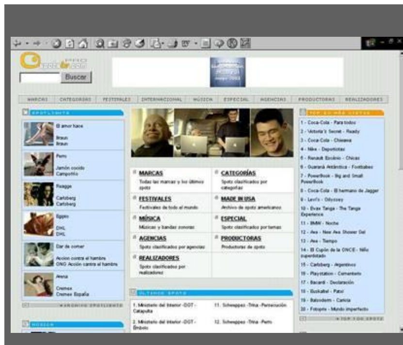
Ilustración 4. Pantalla de búsquedas en Spotstv.com pro

Esta web no trabaja exclusivamente con anuncios, sino que abarca otras informaciones muy útiles para los anunciantes y los publicitarios. Para aportar una visión más global dentro de este ámbito de la comunicación ha creado una serie de directorios, en concreto de agencias, de empresa productoras de filmes y de realizadores de spots.