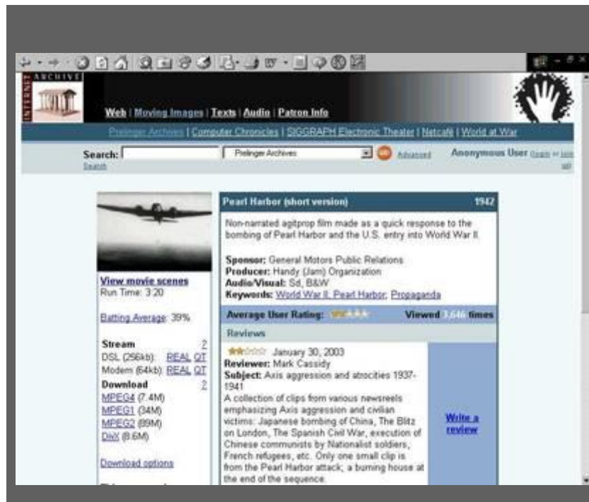
Ilustración 8. Prelinger Archives.

En 1983 constituía uno de los archivos fílmicos más extraordinario, los Archivos Prelinger [23] , cuya tarea era la recuperación y la organización de las películas efímeras filmadas y producidas, no sólo en Estados Unidos, sino también en Canadá. En agosto de 2002 la colección fue adquirida por The Library of Congress.