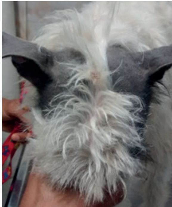
Figura 1. Alopecia circunscrita en áreas negras de pelo.

Se procede a realizar raspado de piel, siendo éste negativo para ácaros de la sarna, y a enviar posteriormente muestra para histopatología de las áreas negras sin pelo afectadas, con el siguiente reporte: Se observa una epidermis con un epitelio