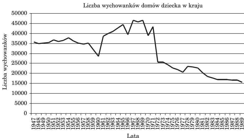
Wykres 2. Ogólna liczba wychowanków domów dziecka w Polsce w latach 1945–1989