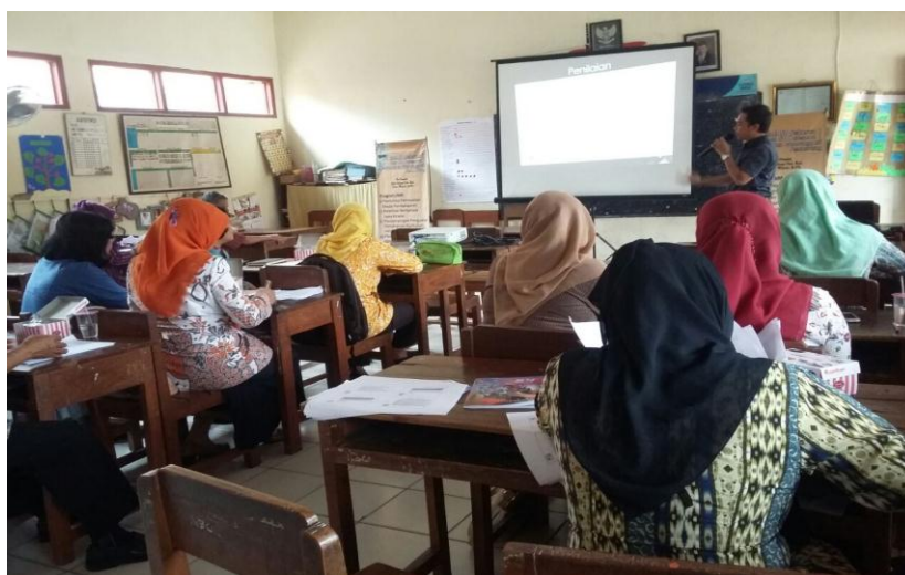
Gambar 4. Mitra IbM sedang mengikuti materi penilaian pembelajaran bahasa Jawa

pilihan ganda dan uraian, padahal penilaian dalam pembelajaran bahasa Jawa jenisnya bermacam-macam disesuaikan dengan aspek keterampilan berbahasa yang ingin dicapai. Penilaian pada aspek membaca berbeda dengan penilaian pada aspek berbicara, begitu juga penilaian pada aspek berbicara berbeda dengan penilaian pada aspek menyimak.