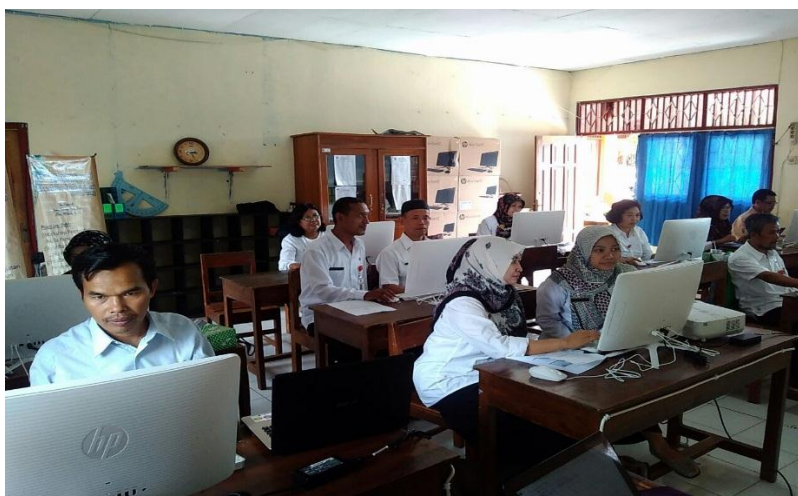
Gambar 2. Mitra lbM sedang membuat media pembelajaran

Media pembelajaran yang dibuat mengambil Kompetensi Dasar (KD) Memahami cerita wayang Yudhistira. Kompetensi Dasar ini diajarkan di kelas 4 kurikulum 2013. Materi-materi tersebut disajikan secara singkat, padat dan jelas. Alat bantu yang digunakan adalah LCD proyektor, dengan harapan tampilan layar dapat diterima oleh semua peserta. Tim lbM juga membuat sebuah modul yang berisi langkah-langkah pembuatannya, sehingga guru tinggal membuka modul tersebut jika mengalami kesulitan.