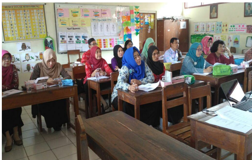
Gambar 3. Mitra IbM sedang mengikuti workshop unggah ungguh basa Jawa

Materi yang dipaparkan dalam workshop diantaranya adalah: (1) sejarah bahasa Jawa, (2) sejarah unggah-ungguh basa Jawa , (3) jenis leksikon dalam bahasa Jawa, dan (4) ragam bahasa Jawa. Konsep program dilaksanakan dengan konsep workshop, artinya tim IbM memberikan teori dilanjutkan praktik. Porsi praktik lebih banyak daripada porsi teori. Berdasarkan hasil penilaian, terjadi peningkatan 6,3% dalam kemampuan berbahasa Jawa krama . Sebelum dilakukan program IbM rata-rata kompetensi dalam hal keterampilan berbahasa Jawa krama adalah 74,75. Setelah diadakan workshop kompetensinya menjadi 79,5.