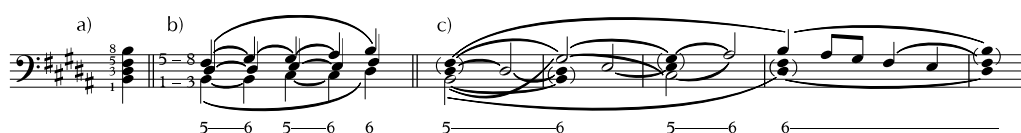
Beispiel 2a: Reduktion von J.S. Bach, Das Wohltemperierte Klavier , Bd. 2, Fuge H-Dur BWV 892: Heinrich Schenker (1925, 97)