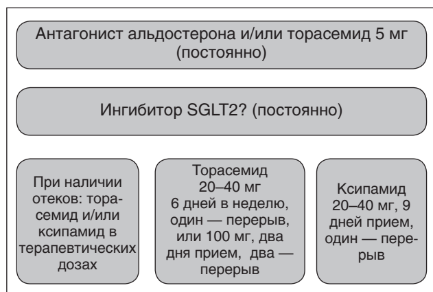
Рисунок 2. Тактика диуретической терапии при ХБП

For the purpose of reno-protection, a patient with CKD receives a renin-angiotensin system blocker (ARB or ACEI) as a basic therapy, regardless of whether a patient has arterial hypertension. In normotension, the patient takes one small dose of ARB/ACEI at bedtime that does not lower blood pressure; in hypertension, the patient takes a therapeutic dose of ARB/ACEI. In hyperten-