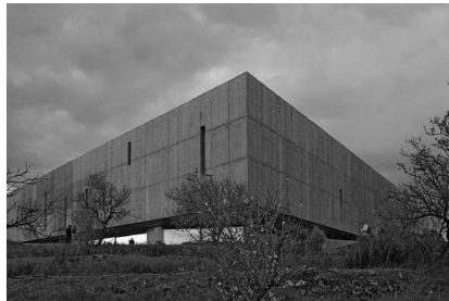
Museu do Coa

É preciso acreditar no turismo, e tal como foi já referido anteriormente, uma das portas abertas ao mundo para um turismo sustentado e sustentável, é de facto o Museu do Coa. Conjugado com as gravuras rupestres, o Museu é um hino à realidade arquitetónica deste país. É necessário apoiar este projeto único para o país e para a preservação da memória da Humanidade. Um museu inserido nas entranhas das encostas do Douro e do Coa, com mais de 800 metros quadrados de área de exposição cultural, o Museu permite fazer uma viagem através da história e verificar o testemunho de diferentes homens e mulheres que deixaram a sua marca nas rochas, desde há cerca de 25000 anos até à contemporaneidade.