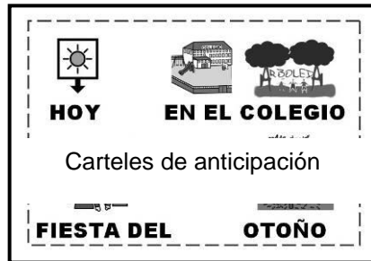
Carteles de anticipación