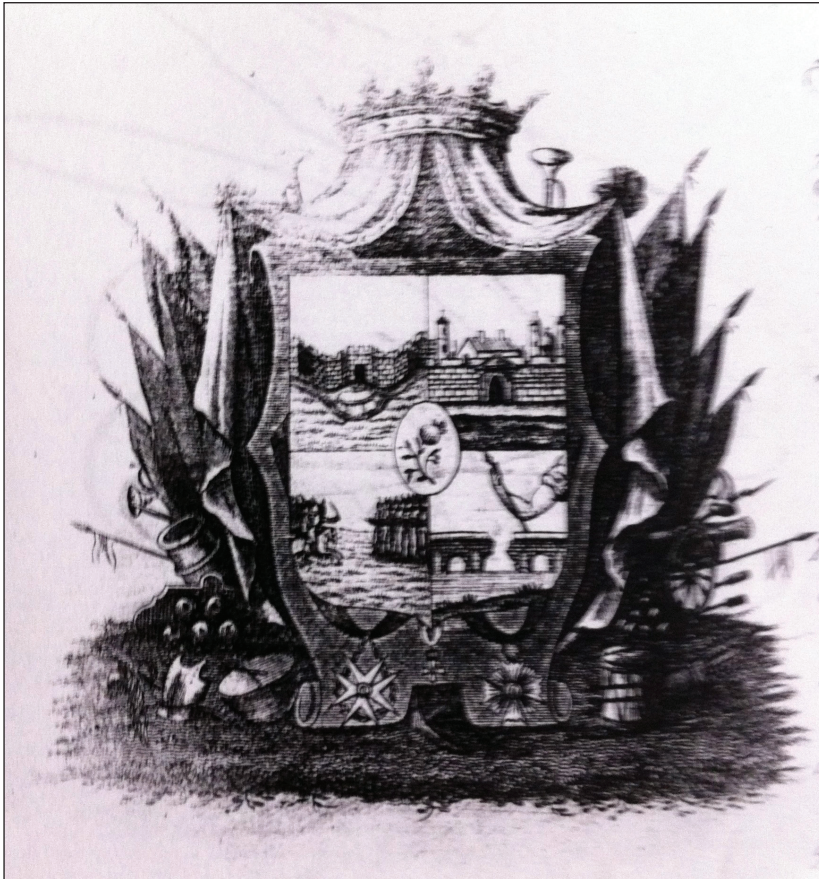
Fig. 7. Heráldica pasaporte militar Pablo Morillo.