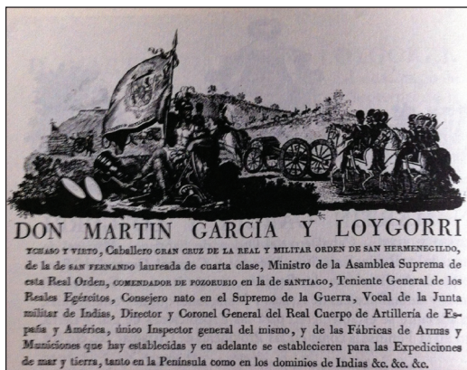
Fig. 5. Encabezamiento pasaporte heráldico de García y Loygorri.