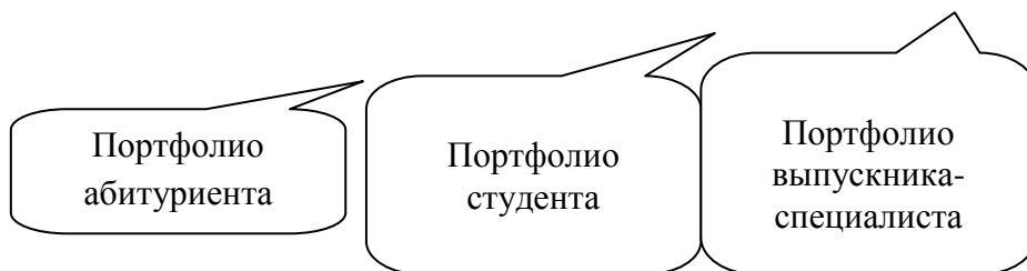
Рисунок 2 – Структура оценки профессиональных компетенций на каждом этапе карьерного роста

Основными задачами внедрения портфолио Абитуриента Мининского университета являются: