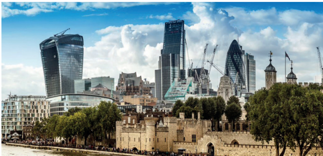
Рис. 7. Лондон. Вид на современную застройку Сити со стороны Тауэра

Что же мы имеем сегодня в относительно крупных городах? Отдельные удачно скомпонованные архитектурно-планировочные образования, комплексы и ансамбли в окружении разнокалиберной, беспокойной, зачастую диссонирующей застройки, допускающей всевозможные вмешательства и ждущей реконструкции. Это постоянно огорчает и раздражает многих, вызывая желание собраться с силами и навести в конце концов полный порядок. Но жизнь идёт, а порядок не возникает. Возникает всё новая и новая порча старины и стихийно сложившихся уголков, пусть неказистых, но любимых кем-то местным жителям.