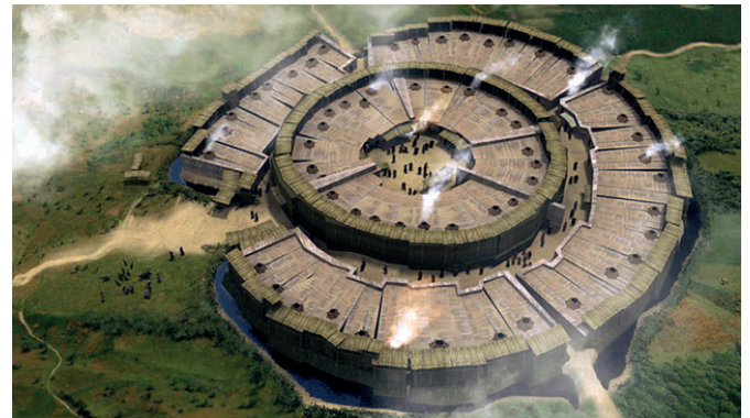
Рис. 2. Аркаим. Реконструкция города XVIII–XVII века до н.э. Южный Урал