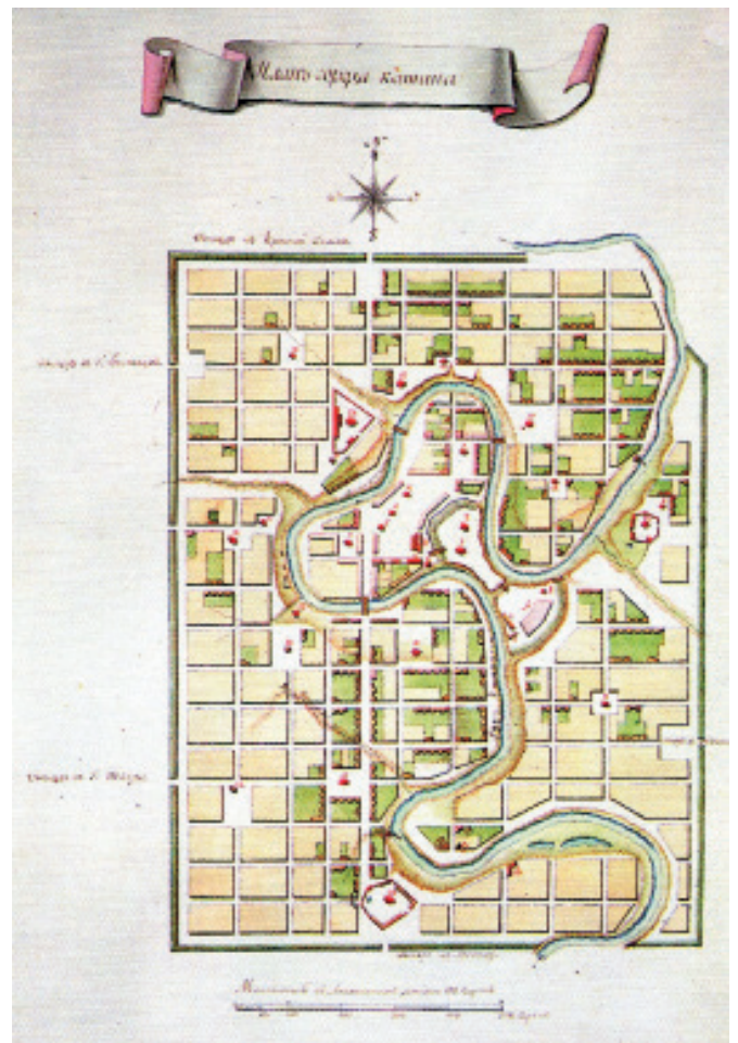
Рис. 6. Кашин. Регулярный план города конца XVIII века. РГВИА [10, с. 231]

Плановое хозяйство в условиях отмены частной собственности весьма поспособствовало воплощению такой идеологии в практике проектирования очень крупных, капитальных и