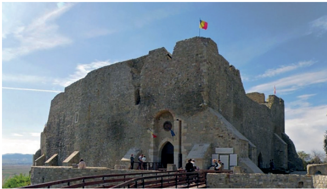
Рис. 3. Средневековая крепость Нямыц. Румыния

Теперь обратим внимание на теряющуюся в веках и свойственную едва ли не всем народам мира традицию выделения главного, наиболее почётного места в глубине здания [9, с. 141–142]. Место же у входа, то есть у передней стены и у ворот (пусть и самых красивых и парадных), считалось низшим.