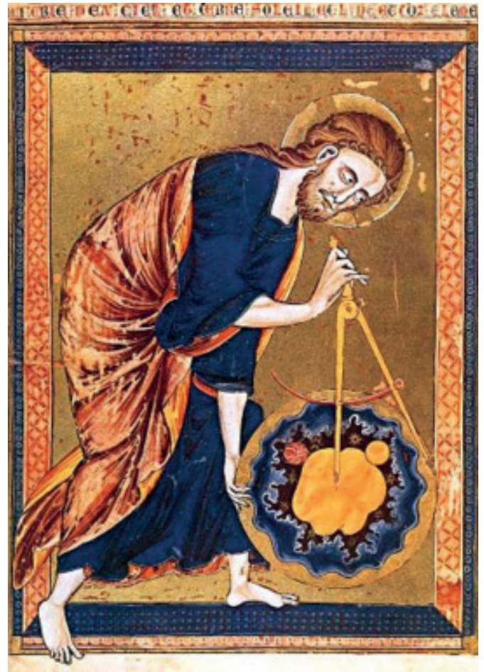
Рис. 1. Сотворение мира. Миниатюра из Библии 1250 года. Франция

Незыблемой считалась вертикальная ось мира, вокруг которой и расходились пространственные круги, вращающиеся с тем большей скоростью, чем дальше от оси они находятся. Важно отметить, что медленно движущиеся и никогда не заходящие за линию горизонта звёзды вблизи неподвижного Северного полюса ассоциировались с вечностью и бессмертием, тогда