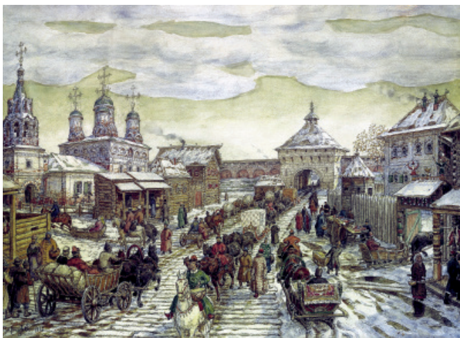
Рис. 4. Городская среда допетровской Москвы на картине А.М. Васнецов «У Мясницких ворот»