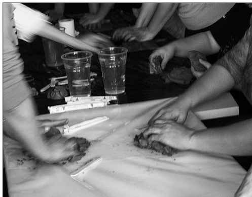
Fig.2. Detalle del grupo de mujeres en proceso de elaboración de trabajos con barro.

El hecho de que algunas mujeres abandonen el proceso, es más significativo de lo aparente. Si bien no es nuestro objetivo el presionar en pro de una mayor aceptación, es interesante ser conscientes de hasta qué punto el hecho de no querer afrontar un proceso de análisis y elaboración personales, o presentar en principio ciertas reticencias o defensas ante nuestra presencia o intervención, nos está aportando valiosa información en referencia a su predisposición, necesidad y capacidad para enfrentarse a aspectos de sí misma que cree ignorar o ante los cuáles sus estructuras defensivas se mantienen aún en alerta. En algunos casos, es su contexto familiar y social el que no favorece o facilita este primer paso.