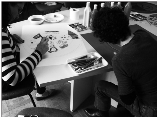
Fig.7. Trabajo con mandalas

En esta experiencia grupal, el arteterapia se convirtió en todo un descubrimiento, en un lenguaje cargado de fuerza, de sentido, de compromiso y de emoción. Cada vez con mayor curiosidad, buscaban en sus obras mensajes que pudieran integrar en sus vidas, señales de esperanza y apertura de caminos para acercarse a sí mismas.