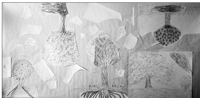
Fig. 5. Trabajo grupal

El taller de arteterapia proporcionó a las participantes una posibilidad de encuentro para la reflexión, el diálogo y la expresión de las propias emociones a niveles muy profundos y significativos, poniéndolas en relación con sus situaciones y vivencias personales, con sus propias biografías, poniendo especial énfasis en aquellos momentos ya vividos que generaron un huella traumática en su psique y que permanecieron en ella sin elaborar, asimilados de manera negativa y dolorosa, bloqueando con ello las emociones generadas y las sensaciones y recuerdos ligados a dicha vivencia. A partir de una serie de propuestas plásticas y en función de unos objetivos de base, tratamos de hacerles ver cómo la expresión simbólica de estas emociones posibilitaba una mejora psíquica y emocional, la re-elaboración de dichos conflictos y su integración de una manera más positiva y menos dolorosa. Todo este proceso, les permitía en último lugar cerrar de manera simbólica esa “herida” que quedó abierta, modificando su comportamiento y actitud ante su propia realidad, e integrándola ahora con la importancia que verdaderamente ha de tener, como una parte más del todo que somos.