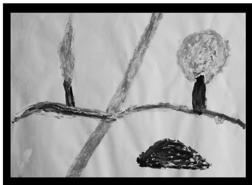
Fig.1. Pintura y música.

Este taller fue promovido por la Delegación de Igualdad, Juventud y Solidaridad Internacional de la Diputación de Cádiz., dentro del “Programa del Circuito Provincial de Talleres Lúdicos y Arteterapia para Mujeres Gaditanas en el ámbito rural (“ARTEMISIA 06/07”)”. Por lo general, las mujeres acuden de manera voluntaria al taller de Arteterapia, o en algún caso derivada por otros profesionales cercanos al campo. Lo hacen con temor y desconfianza, pero por encima de ello, con el deseo firme de poder encontrar nuevos caminos en los que adentrarse y crecer, nuevas formar de ir conformando la vía hacia su bienestar psíquico y salud emocional. Estos aspectos se han visto en su mayoría modificados o deteriorados por los efectos de una convivencia no saludable que se cronifica en el tiempo, unas estructuras sociales y familiares de las que es difícil desprenderse y que ya no se mantienen sobre unos cimientos sólidos, o la repetición de unos hábitos de vida que han dejado de responder a sus propias necesidades. Todo ello se acompaña de una baja autoestima y una transformación de la propia imagen en términos de deterioro y pérdida, que hace que duden hasta de la propia conciencia de su identidad.