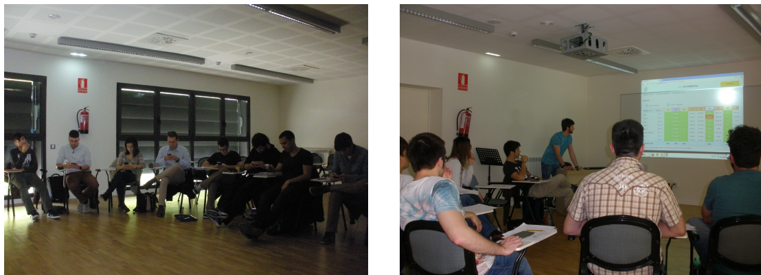
Figura 1. Estudiantes utilizando dispositivos móviles en el aula.

Durante la sesión presencial. Este modelo didáctico consiste en utilizar el tiempo real de clase para potenciar otros procesos de aprendizaje guiados en todo momento por el docente (Bergmann, Overmyer y Wilie, 2013), donde las actividades interactivas son ahora las protagonistas en el aula, en contraposición al discurso magistral (Berret, 2012). El trabajo previo realizado permite liberar un tiempo muy valioso del aula para la relación face-to-face profesor-alumnado, posibilitando realizar otras tareas más prácticas de manera presencial para reforzar el aprendizaje, resolver dudas o profundizar en determinados contenidos. Las actividades que se hacen en clase, por tanto, son más cercanas a la resolución de problemas, actividades de colaboración o discusión en grupo; y totalmente alejadas de ese enfoque tradicional pasivo de clase magistral donde el protagonismo recae únicamente en el profesor. Se parte de la convicción de que, tanto para que el estudiante pueda aprender en casa los contenidos, como para que se pueda comprobar si se han aprendido realmente, se estimule la dinámica del aula o se realicen actividades de tipo colaborativo en ella, el uso de determinadas herramientas TIC es imprescindible.