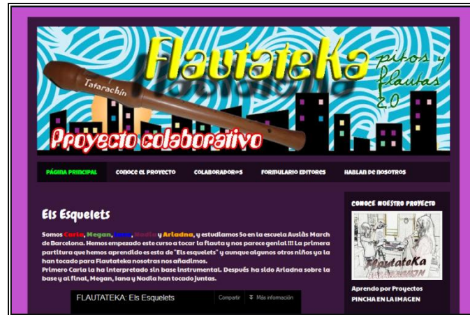
Imagen 3: Blog del proyecto colaborativo Flautateka

Este proyecto fomenta el trabajo colaborativo principalmente entre los individuos del mismo centro educativo. El éxito de todo el grupo depende de la implicación de cada uno de sus miembros, por lo que siguiendo el concepto de interdependencia positiva , los alumnos tienen que adoptar diferentes roles en la misma tarea para conseguir el objetivo final que es la grabación del video. Se deposita cierta responsabilidad individual y colectiva en los discentes, que tienen que desempeñar su rol para alcanzar una meta en conjunto.