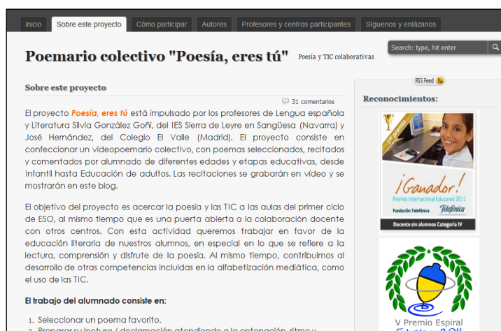
Imagen 2: Blog del proyecto colaborativo Poesía eres tú

por alumnos de diferentes etapas educativas. De esta manera, consigue acercar la poesía a las aulas de una manera dinámica, activa y participativa. Utiliza un blog como lugar de encuentro y para la puesta en común de las diferentes actividades (ver imagen 2).