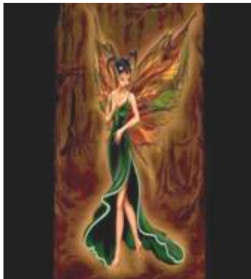
Imagen del personaje: