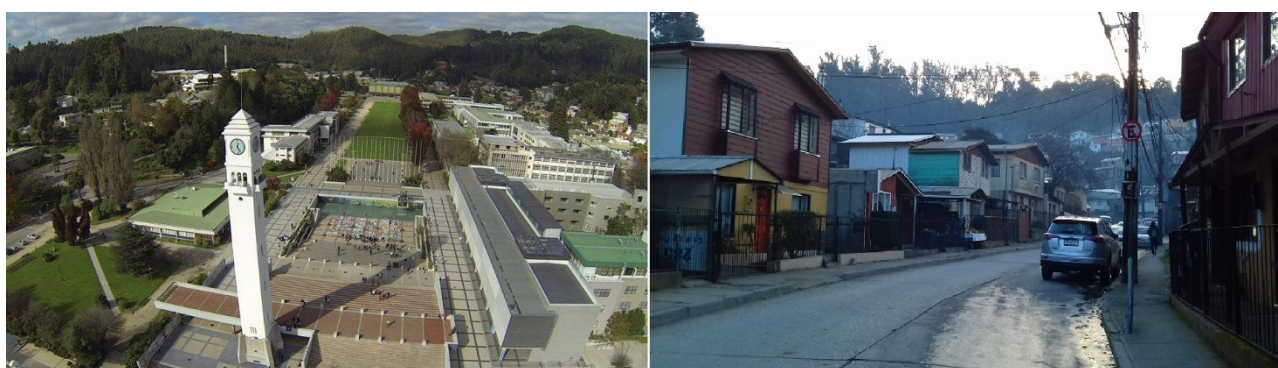
Figura 2. Barrio Agüita de la Perdiz (derecha) y campus de la Universidad de Concepción (izquierda)