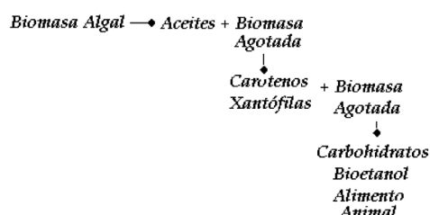
Figura 1. Biorrefinería Microalgal: produciendo múltiples productos de biomasa algal.

Una síntesis del diseño de proceso buscado en este trabajo, dentro del concepto de biorrefinería, se expresa en la Figura 1.