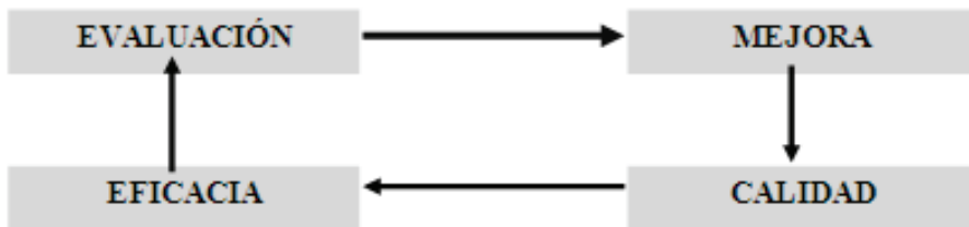
Tabla 1. Proceso de Evaluación

El objetivo fundamental de la evaluación es la mejora de lo que evaluamos, lo que implica dar mayor servicio o calidad a ese aspecto. Pero una dimensión de la calidad es la eficacia con que se haga esa evaluación para que sea como la pescadilla que se muerde la cola y funcione como un feedback del proceso.