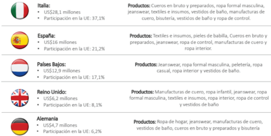
Figura 1. Principales mercados de la EU destino de los productos de la cadena sistema moda en el 2016

a nivel de precios. A continuación, se exponen los principales mercados de la Unión Europea para el sector de confecciones o moda junto con los productos que estos mercados demandan (figuras 1 y 2).