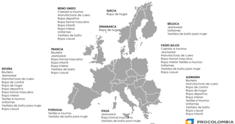
Figura 2. Mercados de oportunidad europeos para la cadena de sistema moda