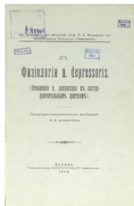
Рис. 2. Титульный лист диссертации Л.Л. Фофанова «К физиологии n. depressoris »

Рецензенты сочли, что Л.Л. Фофанов готов к самостоятельным научным исследованиям, отметили его обширные познания в области