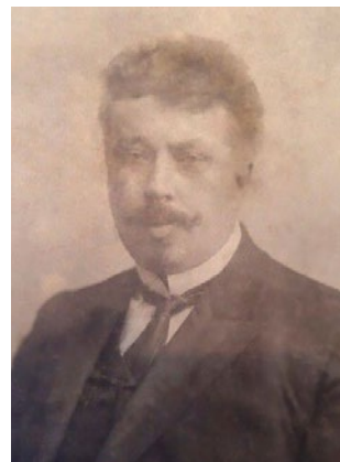
Рис. 1. Лев Львович Фофанов

В годы Гражданской войны поистине ужасающие масштабы приняла эпидемия сыпного тифа. Для борьбы с сыпным тифом в 1919 г. Казанский губздрав создал чрезвычайную комиссию, в состав которой вошёл и профессор