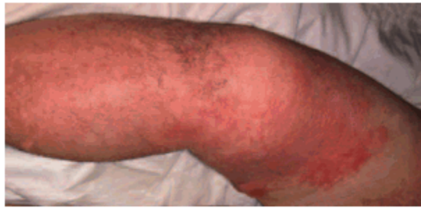
Figura 2 a) Fascitis necrosante