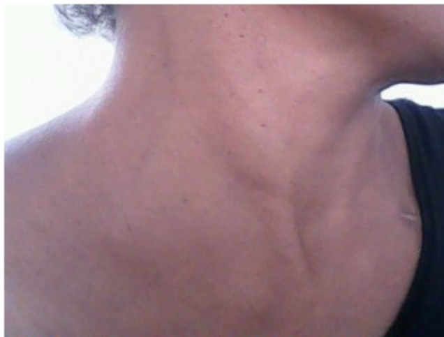
Figura 1. Se observa el aumento de volumen en ganglios de cadena cervical lateral derecha.