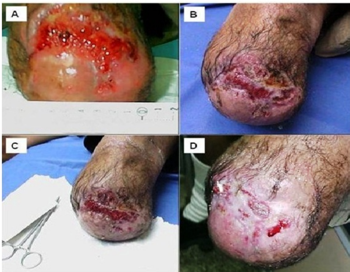
Foto 2. Úlcera vascular : sin tratamiento (A), después de 1 semana de tratamiento con el equivalente epidérmico (B), al cabo de la segunda semana de tratamiento con el equivalente epidérmico (C), a la tercera y cuarta semana de tratamiento con el equivalente epidérmico (D).

La evolución del resto de los pacientes fue la esperada con este tipo de procedimiento, respondieron todos al tratamiento con los implantes. Dos de los pacientes tratados, como consecuencia de que el tamaño de la úlcera era muy grande, mayor de 50 cm 2 , además de la condición de ser úlceras con lesiones crónicas de larga data, presentaban lechos muy atróficos para que el tratamiento con los equivalentes funcionaran bien, por lo que fue necesario una limpieza inicial de la herida para retirar el tejido fibroso y necrótico, y de esta manera crear un ambiente óptimo para recibir el trasplante. Esto hace que las células del equivalente puedan actuar induciendo la regeneración de las células del borde de la úlcera de la piel del paciente.