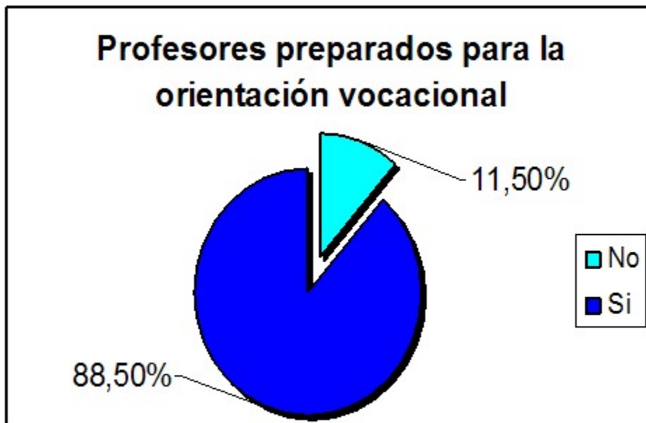
Gráfico 3. Percepción de profesores sobre su preparación para la orientación vocacional

El 87,6 % de los profesores (92) participaron con los estudiantes en las actividades de orientación vocacional que se planificaron y consideran que estas actividades preparan al estudiante para las pruebas de aptitud y posteriormente para una buena elección de la carrera, pues las actividades conciben el desarrollo de habilidades, conocimientos necesarios para responder las preguntas que se hacen en la prueba de actitud y los preparan para ser un buen profesional.