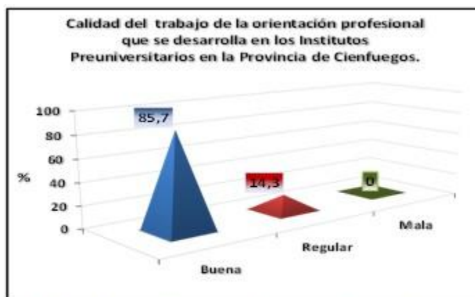
Gráfico 1. Calidad del trabajo de orientación profesional realizado según opinión de los Consejos de Dirección de los institutos preuniversitarios

Los consejos de dirección de 18 preuniversitarios (85,7 %) consideran que el trabajo de orientación vocacional desarrollado con los estudiantes al implementar el sistema de acciones es bueno, mientras que los institutos preuniversitarios Owen Fundora, Armando Mestre y Juan Alberto Díaz lo evalúan de regular (14,3 %), refiriendo que la lejanía de la cabecera municipal es la principal causa. (Gráfico 1).