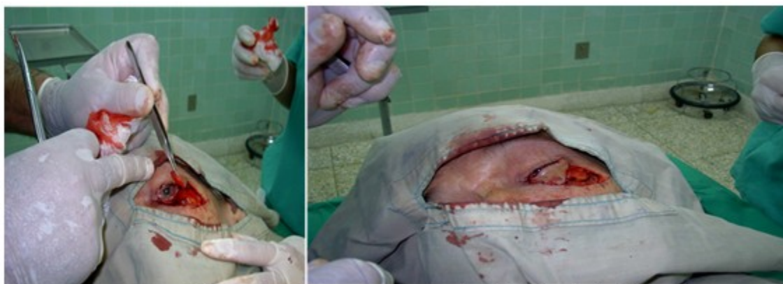
Figura 2. Momentos del acto quirúrgico que muestran la aplicación de la técnica descrita.

De los 15 pacientes operados, 9 fueron mujeres y 6 hombres, todos de color de la piel blanco, con edades comprendidas entre 60 y 80 años. En todos se utilizó colgajo miocutáneo, acompañado de una fina lámina de cartílago de la concha auricular. De los 15 pacientes operados solo uno tuvo una evolución tórpida, pero al final el resultado fue satisfactorio. (Figura 2, Figura 3).