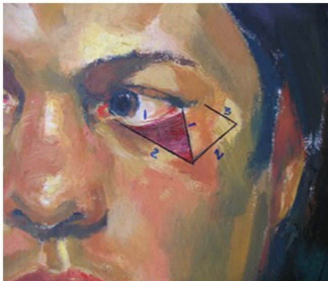
Figura 1. Diseño de la técnica modificada. El punto 2 corresponde a la altura del lecho. El punto 3 es llevado a ocupar el borde inferior de la herida.

Esta investigación contó con la aprobación del Consejo Científico del Hospital. Las imágenes y datos han sido utilizados previo consentimiento informado a los pacientes.