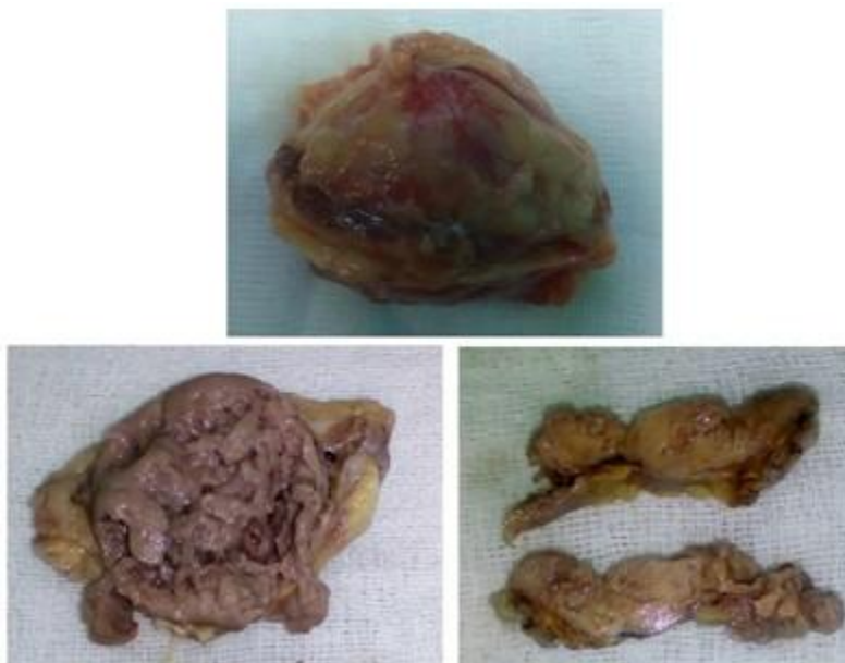
Figura 3: Imagen que muestra la anatomía macroscópica del tumor. Nótese las características externas al corte.

Tienen predominio en el lado derecho, sin conocerse la causa. En sentido general, el 90 % de estas neoplasias cromafines tienen una presentación esporádica, frente a solo un 10 % con presentación familiar. En este último caso se sabe que puede heredarse de forma aislada con herencia autosómica dominante o dentro de síndromes hereditarios, tales como: enfermedad