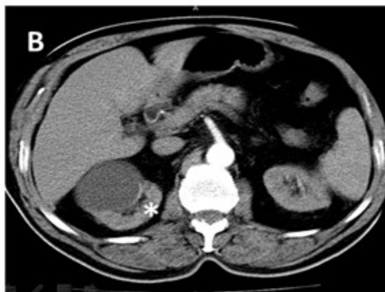
Figura 2: Imagen tomográfica que muestra el tumor (señalado por asterisco)

El paciente comenzó de forma súbita con disnea intensa que llegó a impedir el decúbito. Este cuadro se interpretó nosológicamente como un edema agudo del pulmón, del cual no logró estabilizarse y el paciente falleció.