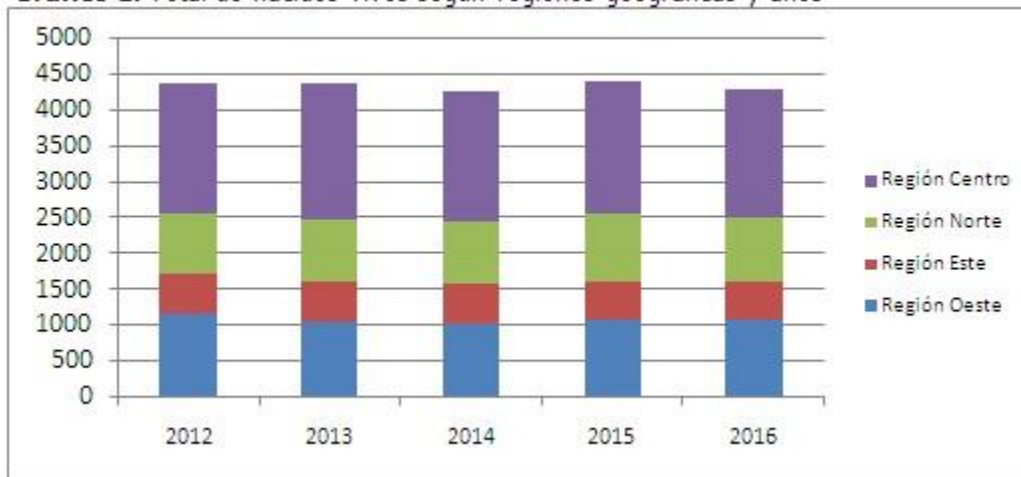
Gráfico 1. Total de nacidos vivos según regiones geográficas y años

Se observó una distribución heterogénea del porcentaje de positividad de la primera determinación (UMELISA TSH NEONATAL) según regiones geográficas y años. Las regiones oeste (1,87%), norte (1,34%) y este (1,33%) muestran los mayores valores de positividad que contrastan con los expuestos en la región centro