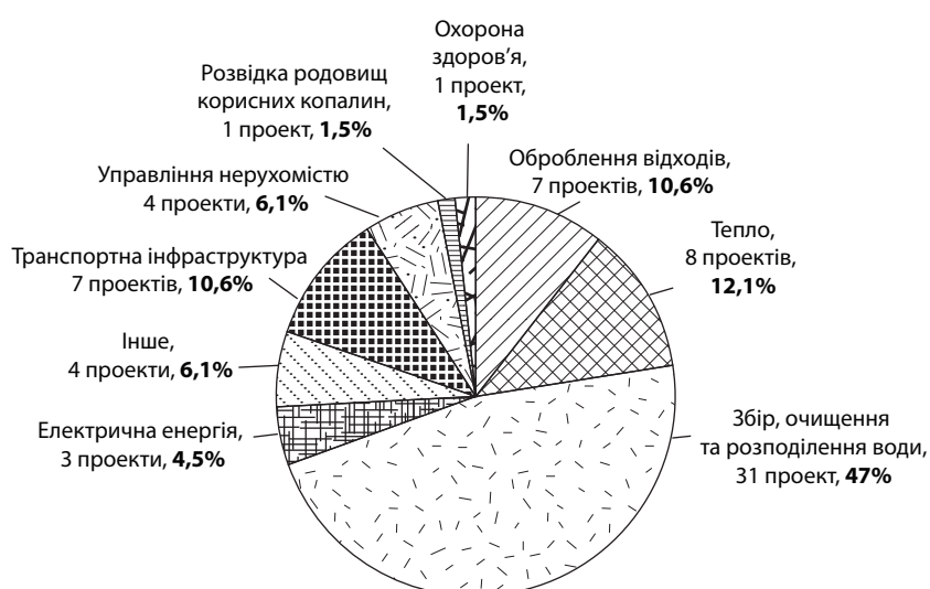
Рис. 2. Структура та кількість проектів державно-приватного партнерства в Україні за сферами господарської діяльності