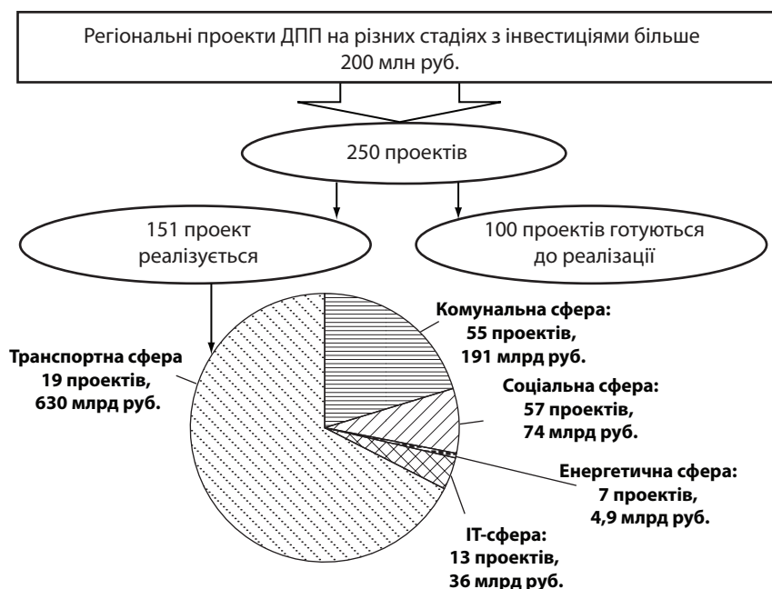
Рис. 3. Регіональні проекти ДПП в ЄАЕС станом на третій квартал 2016 р.

Уточнення сутнісно-класифікаційних ознак, методологічного підґрунтя державно-приватного партнерства та поступове удосконалення аналітичного інструментарію у цій сфері сприятиме більш широкому й усвідомленому налагодженню взаємовідносин у сфері ДПП в Україні. Створена на принципах соціальної відповідальності й інвестиційно-інноваційного розвитку аналітична та рекомендаційна база дозволить сформувати комплексне бачення подальшої співпраці державного та приватного секторів української економіки. Це, своєю чергою, позитивно вплине на прийняття управлінських рішень, спрямованих на: покращення економічних, соціальних та екологічних параметрів функціонування державних підприємств з мінімізацією всіх видів ризиків; запобігання помилкам, здійсненим у минулих періодах, що впливають на діяльність державних установ; формування тактичних і стратегічних векторів розвитку суб'єктів бюджетного сектора націо-