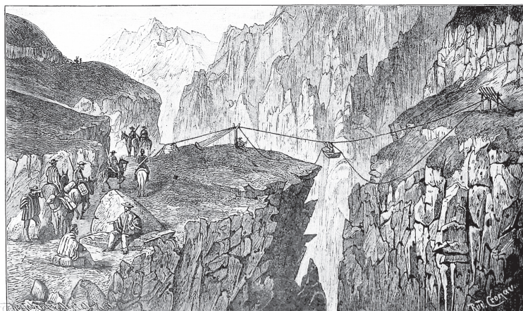
FIGURA 2 TRANSPORTE EN LOS ANDES

Fuente: ALWIN OPPEL y ARNOLD LUDWIG (eds.). Ferdinand Hirt's Geographische Bildertafeln (Hansebooks, 1884).