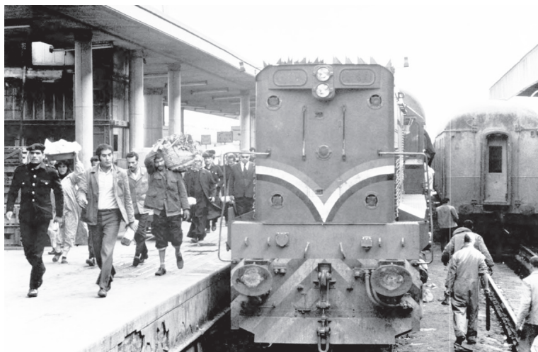
FIGURA 5 ESTACIÓN CENTRAL DE EL CAIRO EN 1975

Nota: en 1971, la Asociación Internacional de Fomento aprobó un préstamo de 30 millones de dólares a Egipto para un proyecto ferroviario.