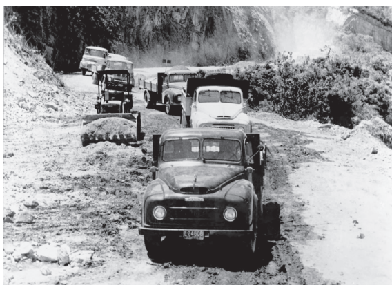
FIGURA 3 CAMIONES MOVIÉNDOSE LENTAMENTE A LO LARGO DE UNA CARRETERA DE MONTAÑA A LAS AFUERAS DE BOGOTÁ

Nota: En 1961, el Banco Mundial y la Asociación Internacional de Fomento proporcionaron 39 millones de dólares a Colombia para un programa de mejoramiento de carreteras.