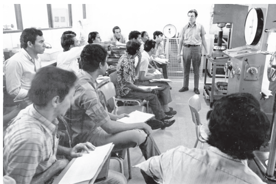
FIGURA 4 ESTUDIANTES RECIBIENDO CAPACITACIÓN MECÁNICA EN BARRANQUILLA EN 1971

Nota: Escuela establecida como parte de un proyecto del Banco Mundial para promover la educación superior técnica, y no solo universitaria, en el país.