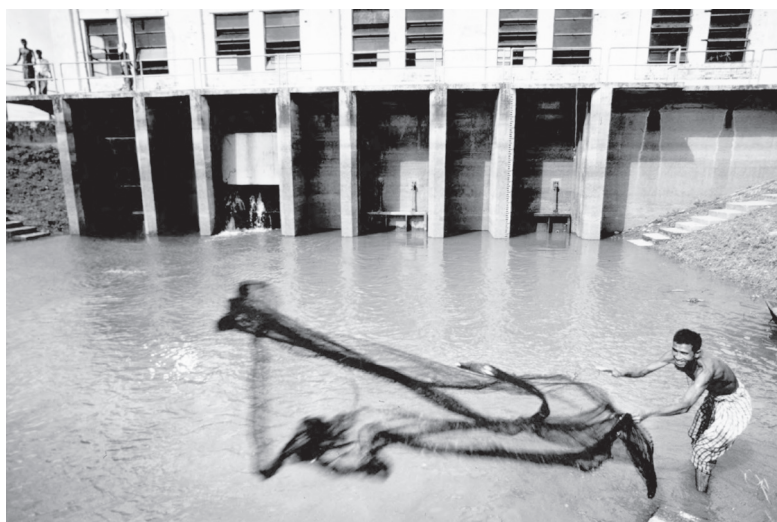
FIGURA 6 SISTEMA DE RIEGO EN BANGLADESH

Nota: Con un crédito del gobierno sueco y la Asociación Internacional de Fomento, y una subvención canadiense, este proyecto en Bangladesh, aprobado en 1972, tuvo como objetivo aumentar la producción y el empleo mediante la construcción de sistemas de riego y el apoyo a la producción agrícola. Foto: Tomas Sennett. Carpeta ID 1716085, Archivos del Grupo del Banco Mundial.