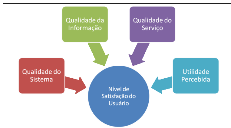
Figura 1 Modelo de Satisfação do Usuário