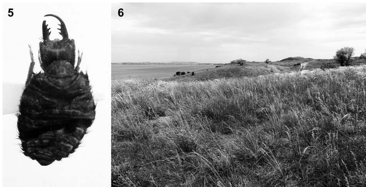
Рис. 5–6. Личинка Acanthaclisis occitanica (5) и ее местообитание в псаммофитной степи на южном берегу Таманского залива западнее пос. Сенной, 25 мая 2013 года (6).

Figs 5–6. Larva of Acanthaclisis occitanica (5) and its habitat in psammophytic steppe on the south shore of Taman Bay west of Sennoy village, 25 May 2013 (6).