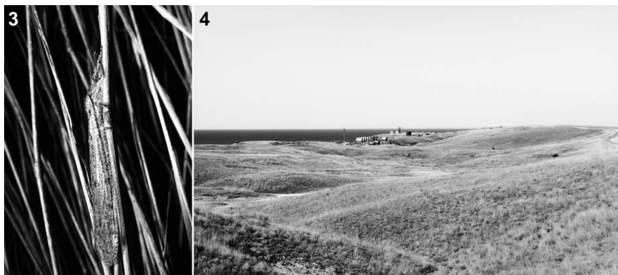
Рис. 3–4. Характерное положение в покое имаго Synclisis baetica на стебле злака (3) и место массового ночного лёта вида на Таманском полуострове 21 августа 2013 года (4).

Figs 3–4. Characteristic resting position of Synclisis baetica imago on the stem of a grass (3) and the location of mass night flight of the species on the Taman Peninsula, 21 August 2013 (4)