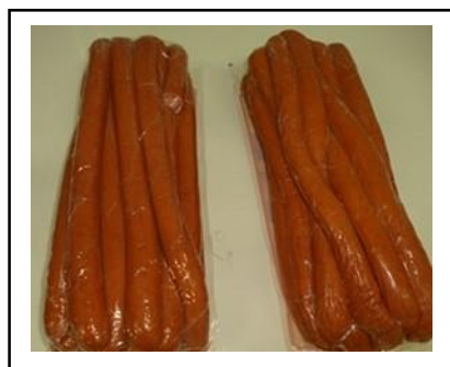
Figura 2. Amostra padrão

Na Figura 2 podemos observar o padrão de produto desejável e nas figuras 3, 4 e 5 os possíveis defeitos que este pode apresentar.