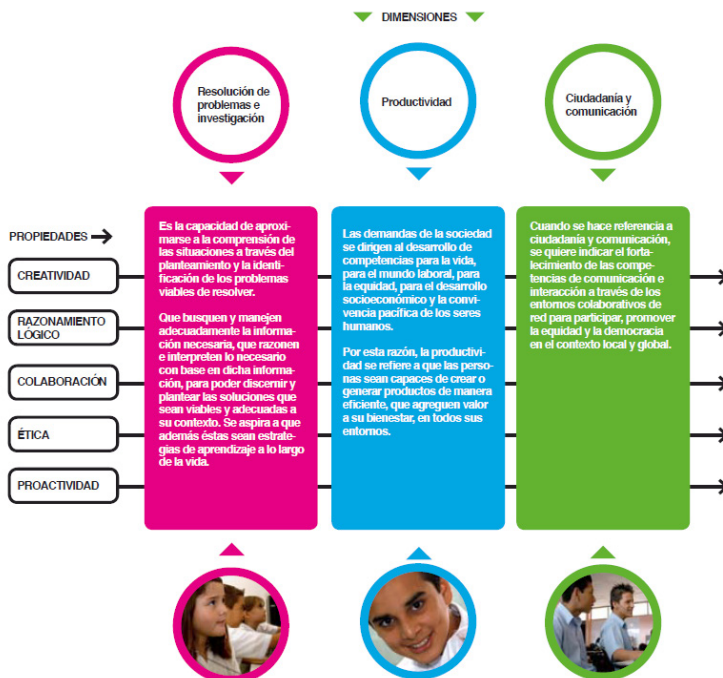
Figura 3. Estándar de Desempeño de estudiantes en el aprendizaje con tecnologías digitales.

Costa Rica, ha definido Estándares de Desempeño de estudiantes en el aprendizaje con tecnologías digitales (Zuñiga & Brenes, 2011) organizados en dimensiones y propiedades como se aprecia en la figura 3.