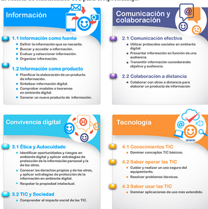
Figura 2. Matriz de Habilidades TIC para el Aprendizaje.

La prueba PISA de la ODCE, que tradicionalmente había evaluado tres clases de competencia –en lengua, matemática y ciencia–, ha incluido a partir de 2009 la competencia para la lectura digital – digital reading literacy –, basándose en el entendido de que “Thus, digital reading cannot always be strictly compared to print reading. This is, in fact, the best evidence in support of the design of a new framework and new assessment procedures for digital reading.” (OCDE, 2009, p. 36). No todos los países de América Latina participan en la prueba de lectura digital de Pisa.