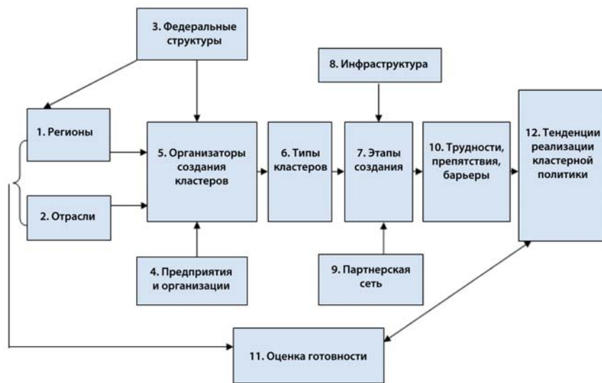
Рис. 2. Блок-схема предмета исследования и обозначение базовых переменных

В научном плане речь идет об экспликации явных и латентных функций и структур социальных организаций, вовлекаемых в реализацию инновационной политики, способствующих или препятствующих ускорению создания и распространения конкурентоспособных технологий, а также корректировке на этой основе и среднесрочных прогнозных оценок, необходимых для разработки стратегических планов и задач. Центральной проблемой здесь становится управляемость процесса инновационной индустриализации на макро-, мезо- и микроорганизационных уровнях. Предметом выступает влияние организованных (вертикально-интегрированных) и спонтанных (самоорганизующихся, горизонтально-интегрированных) факторов на тенденции в реализации кластерной политики.