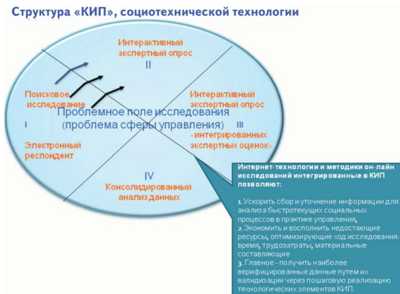
Рис. 1. Комплексный интерактивный продукт

Методология и методика сбора данных. Целью поискового онлайн – исследования была проверка при помощи социотехнической технологии дистанционного сбора и анализа данных возможностей социально-организационного зонирования экономических и технологических пространств, включенных в кластерную политику в рамках концепции инновационной индустриализации [5].