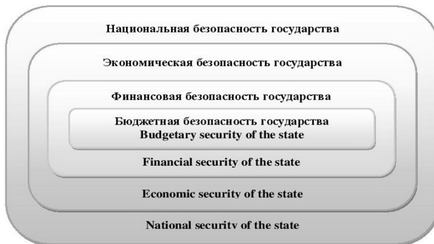
Рисунок 1. Декомпозиция бюджетной безопасности государства Figure 1. Decomposition of state budget security

безопасность»: управленческий, системный, балансовый, комплексный, оценочный и условный.