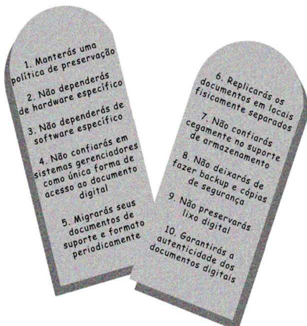
Figura 3 – Os 10 mandamentos da preservação digital

Na figura 3, Innarelli (2007) cita os 10 mandamentos da preservação digital: