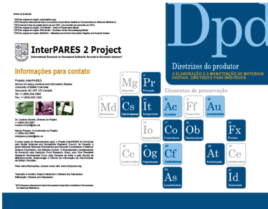
Figura 1 – Diretrizes do produtor

“Diretrizes do produtor” (figura 1) apresenta um conjunto de recomendações e boas práticas