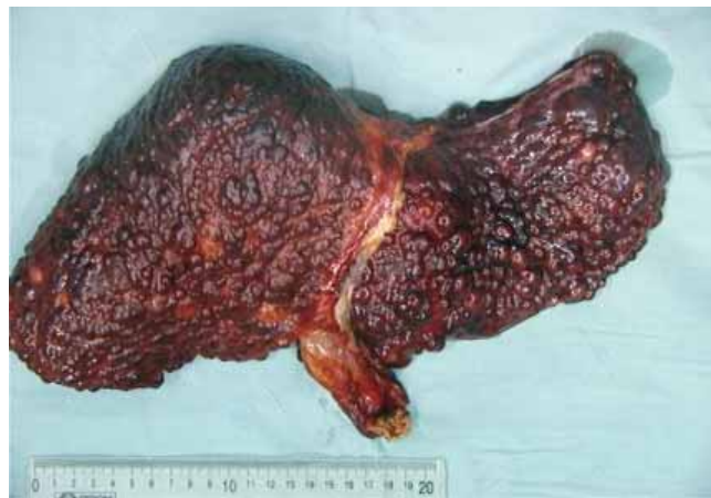
Рис. 1. Печень пациентки А.

После выписки у пациентки сохранялись асцит, спленомегалия (максимальный размер селезенки до 30 см),