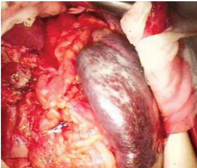
Рис. 3. Селезенка больной А. при спленэктомии

в объеме 3500 мл; в верхнем этаже — умеренно выраженный спаечный процесс; увеличение размеров селезенки — 30×25×20 см (рис. 3). При интраоперационном УЗИ отмечена неоднородность паренхимы селезенки за счет наличия участков ишемического повреждения.