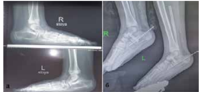
Рис. 2. Пациентка П., 9 лет. Результаты рентгенографии обеих стоп: эквино-плано-вальгусная деформация с обеих сторон до операции (а); интраоперационная коррекция деформаций стоп (б)

Fig. 1. Patient P., 7 y. o. Sagittal (left) and axial (right) magnetic resonance image of the brain dated 03.06.2016: expansion of convexital subarachnoid spaces, asymmetric expansion of the ventricular system, expansion of Virchow—Robin perivascular spaces, hypoplasia of the corpus callosum