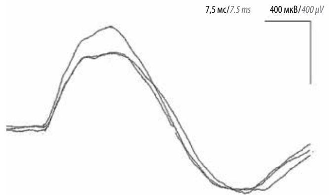
Рис. 2. Нормальный М-ответ с диафрагмы при стимуляции диафрагмального нерва у ребенка 12 лет

дискомфорт не предъявляли. Предельная сила тока, при которой регистрировался М-ответ максимальной амплитуды, не превышала 40 мА. Средние значения латентности и амплитуды М-ответа по всей группе соответственно составили 5,64 \pm 1,25 мс и 0,66 \pm 0,34 мВ. При разделении на возрастные подгруппы 1–2 года ( n = 7 ), 3–5 лет ( n = 9 ), 6–12 лет ( n = 15 ) и 13–18 лет ( n = 17 ) латентность составила 4,96 \pm 1,94 ; 5,01 \pm 1,13 ; 5,42 \pm 0,84 и 6,44 \pm 1,43 мс, амплитуда – 1,01 \pm 0,37 ; 0,87 \pm 0,31 ; 0,61 \pm 0,24 и 0,45 \pm 0,21 мВ соответственно. Значения амплитуды М-ответа для детей в возрасте 1–2 лет отличались от таковых у детей в возрасте 6–12 и 13–18 лет ( p < 0,05 ). При этом достоверных различий латентности между детьми разного возраста не получено.