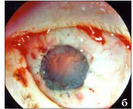
Рис. 3. Глаз пациента П. со стафиломой роговицы: а) до операции; б) после операции