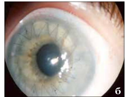
Рис. 2. Глаз пациента с врожденной эндотелиальной дистрофией роговицы: а) до операции; б) после операции