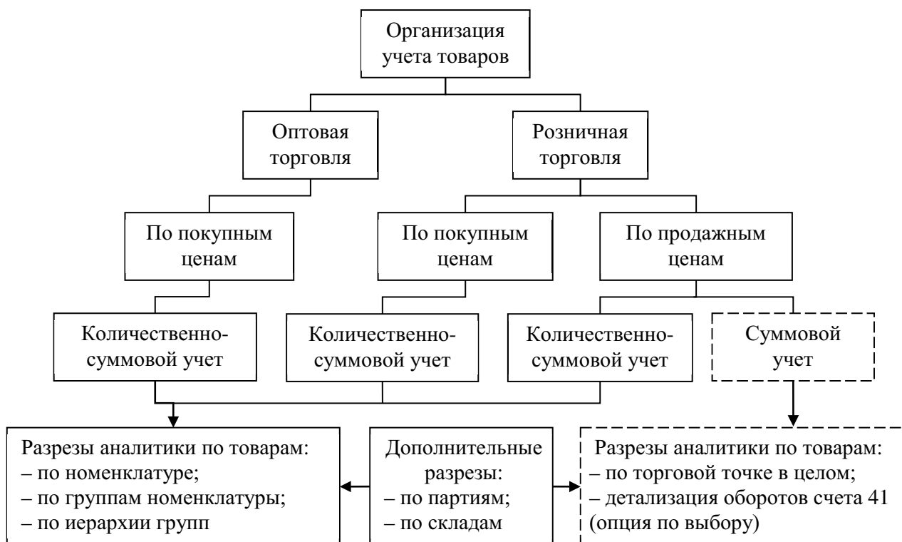
Рис. 3. Варианты организации аналитического учета товаров

Однако в целях АВС-метода значимость имеет не сам кредитовый оборот, а его детализация в разрезе конечных объектов калькулирования — видов товаров, на которые с помощью драйверов должна распределяться стоимость выполнения операций. Заметим, использование в качестве калькуляционных объектов отдельных партий товаров не ведет к желаемому результату, так как распределенная между партиями стоимость операций увеличивает стоимость конкретных партий. В то же время применение метода оценки товаров по средней взвешенной ведет к усреднению себестоимости