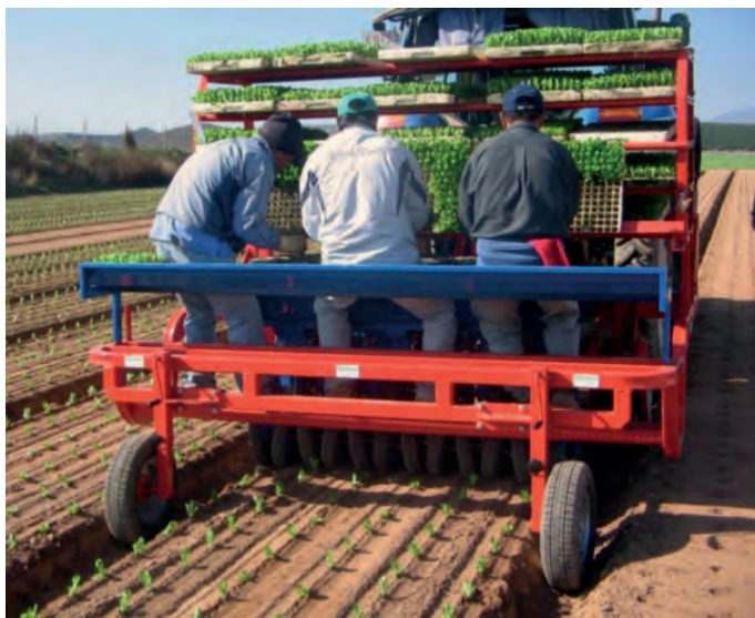
Рис. 2. Механизированная посадка рассады салата-латука. Fig. 2. Mechanized planting of lettuce.