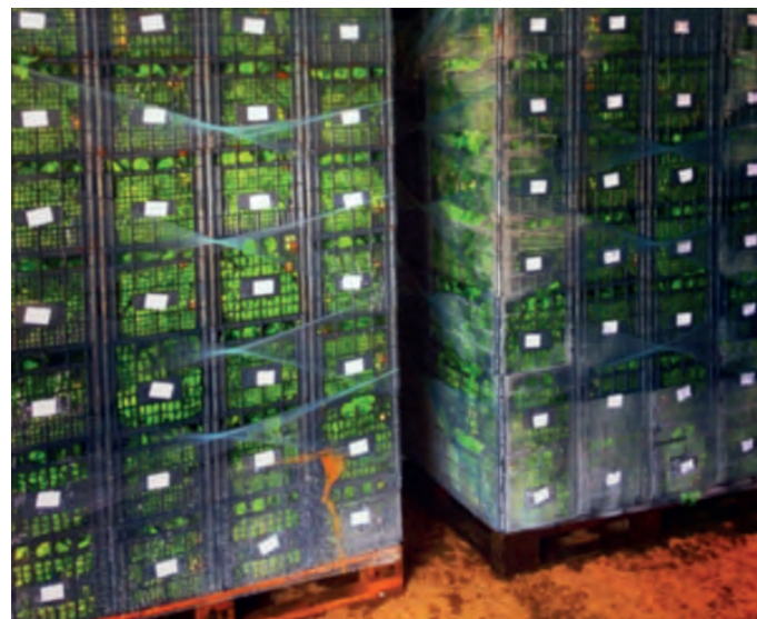
Рис. 3. Поддоны с ящиками с готовой продукцией. Fig. 3. Pallets with boxes with finished products.

дневный мониторинг состояния растений, почвы, погодных условий.