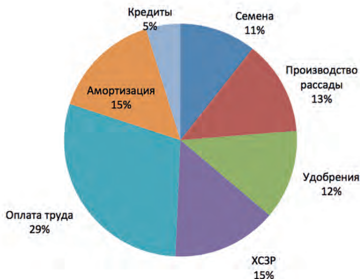
Рис. 4. Структура затрат производства салата-латука в ООО «Весёлый агроном». Fig. 4. The structure of the costs of production of lettuce in LLC "Veselyy Agronom".

ство салатной продукции до 1,8 тыс. т и расширить посевы других овощных культур на арендуемых землях.