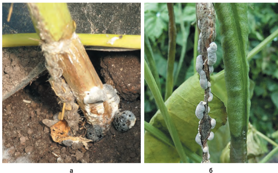
Рис. 4. Поражение основания стебля (а) и плодов (б) спаржевой вигны Sclerotinia sclerotiorum (Lib.) de Bary. Fig. 4. Defeat of stem base (a) and fruits (b) of asparagus vigna Sclerotinia sclerotiorum (Lib.) De Bary

На плодах вигны в условиях теплицы доминирующее положение занимали некротрофные виды Sclerotinia