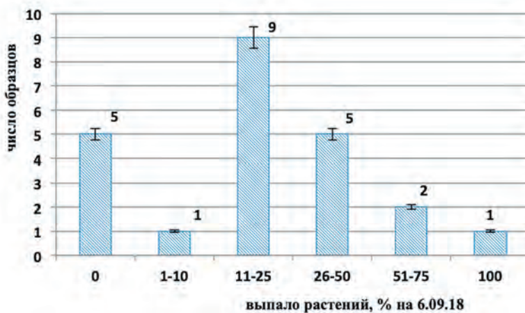
Рис.6. Количество выпавших растений сортообразцов V. unguiculata в конце вегетационного периода в результате поражения растений Sclerotinia sclerotiorum и Botrytis cinerea (n=23). Fig.6. The number of fallen plants of varietal samples of V. unguiculata at the end of the vegetation period as a result of the defeat of plants of Sclerotinia sclerotiorum and Botrytis cinerea (n = 23).