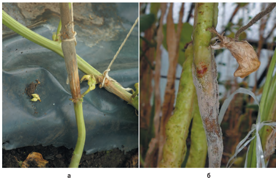
Рис. 5. Поражение стебля (а) и плодов (б) вигны возбудителем серой гнили B. cinerea Pers. Fig. 5. Defeat of the stem (a) and fruit (b) of asparagus vigna by B. cinerea Pers.