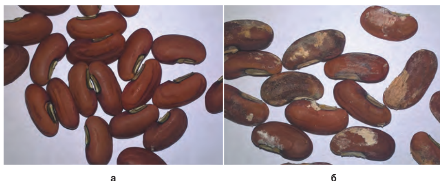
Рис. 1. Семена Vigna unguiculata , сорт Юньнаньская: здоровые (а) и с симптомами семенной инфекции (б) Fig. 1. Seeds of Vigna unguiculata , cultivar Yunnanskaya: healthy (a) and with symptoms of a seed infection (b)

Результаты фитоанализа, проведенного ранее с семенами представителей дикорастущих видов семейства Fabaceae в ЦСБС СО РАН, показали, что на семенах исследуемых дикорастущих видов бобовых